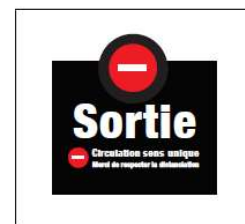
24 x 24 - Verso