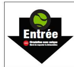
24 x 24 - Recto